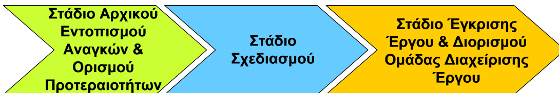
Σχήμα 1-4: Τα τρία στάδια της Έναρξης Έργου